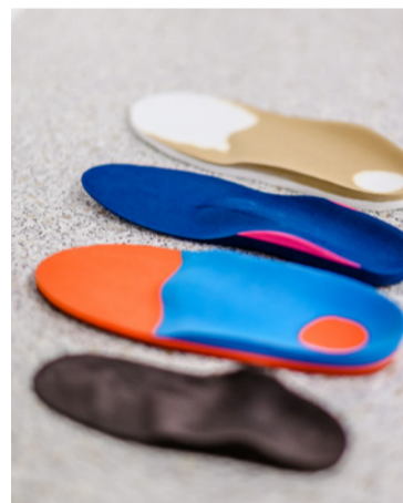
Maßgefertigte Einlagen aus der hauseigenen CNC-Fräse