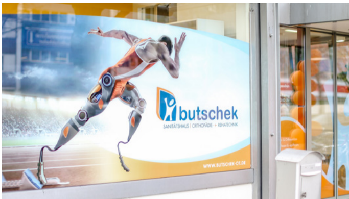
Das butschek Sanitätshaus startet seit März 2017 auch in der Stresemannstraße 52 durch.

Das Fachpersonal sowie die Orthopädiertechnik-Meister des butschek Sanitätshauses nehmen sich gern Zeit für die Wünsche und Sorgen Ihrer Kunden. Besonders Prothesen- und Orthesenkunden finden viel Platz in den modernen Anproberäumen. Außerdem gibt es eine große Auswahl an Rollstühlen und Rollatoren.